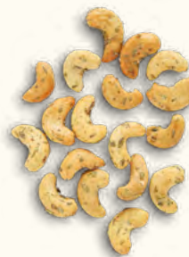
Noix de cajou grillées aux herbes de Provence (Burkina Faso/Belgique)