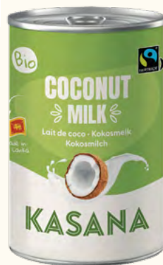
Lait de coco 17% (Sri Lanka)