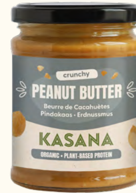
Beurre de cacahuètes «crunchy»