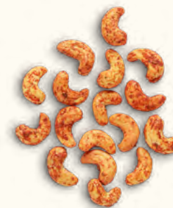
Noix de cajou grillées au chili (Burkina Faso/Belgique)