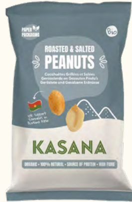
Cacahuètes grillées & salées (Burkina Faso/Belgique)