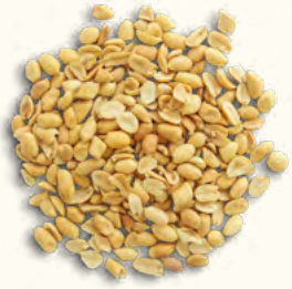
Cacahuètes grillées et salées (Burkina Faso/Belgique)