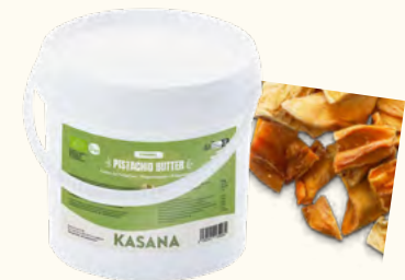
Purée de pistaches