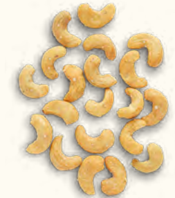
Noix de cajou grillées à la fleur de sel (Burkina Faso/Belgique)