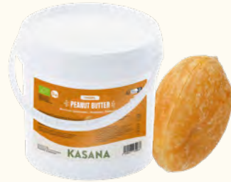
Beurre de cacahuètes «creamy»