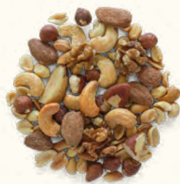
Mix de noix grillées et salées (UE/Non-UE)