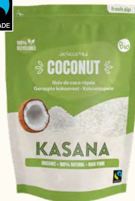
Coco râpée (Sri Lanka)

Poids net : 180 g (sachet en plastique refermable)