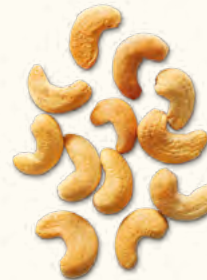
Noix de cajou grillées nature (Burkina Faso)

SPLIT/LWP/FB 6kg (seau consigné) 22,68kg (sac sous vide)