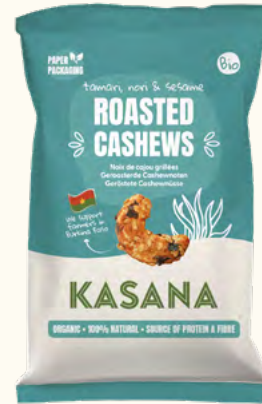
Noix de cajou grillées au tamari, nori & sésame (Burkina Faso/Belgique)

Poids net : 150 g (sachet en plastique recyclable)