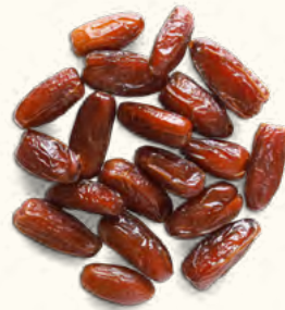
Dattes sèches dénoyautées (Algérie)