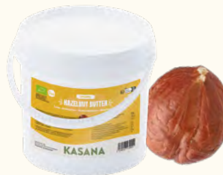
Purée de noisettes