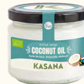
Huile de coco (Sri Lanka)