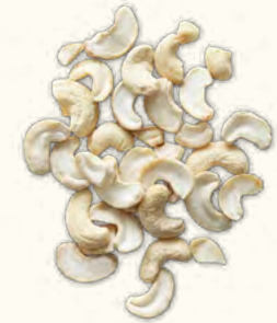
Noix de cajou nature en morceaux (Burkina Faso)

SPLIT/LWP/FB 6kg (seau consigné) 22,68kg (sac sous vide)