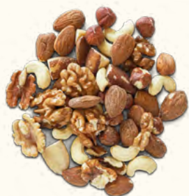
Mix de noix (UE/Non-UE)