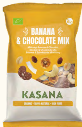
Mix Banane Chocolat (Non-UE)