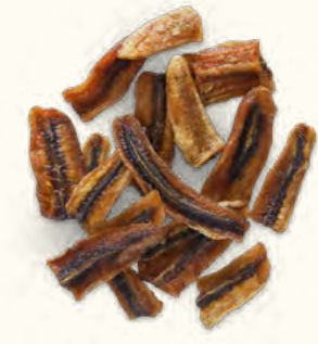
Bananes en lamelles (Togo)

2 kg (poche sous vide) EAN 5430000538756