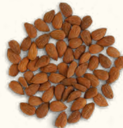
Amandes grillées et salées (Italie/Belgique)

2 x 5 kg (poches + carton) EAN 5430000538411 25 kg (sac)