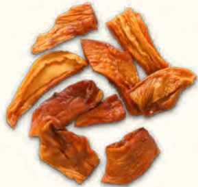
Mangues en demi-lamelles (Burkina Faso)

Amélie / Lippens / Brooks > possibilité FAIRTRADE 2,5 kg (poche sous vide)