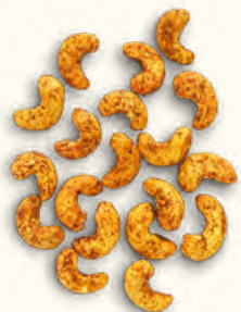
Noix de cajou grillées au curry (Burkina Faso/Belgique)