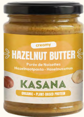
Purée de noisettes