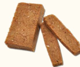
Pâte de dattes (Algérie)