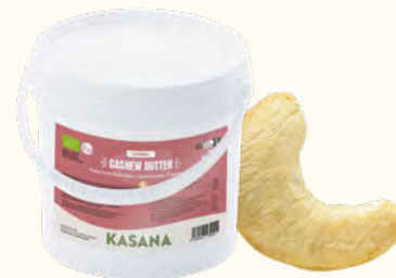
Purée de noix de cajou