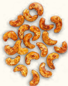
Noix de cajou grillées au tamari (Burkina Faso/Belgique)