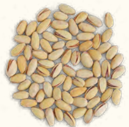
Pistaches en coque grillées et salées (Espagne/Belgique)