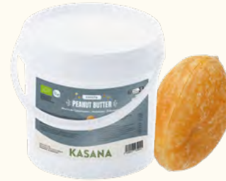
Beurre de cacahuètes «crunchy»