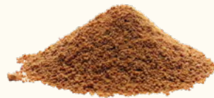
Sucre de fleur de coco (Sri Lanka)