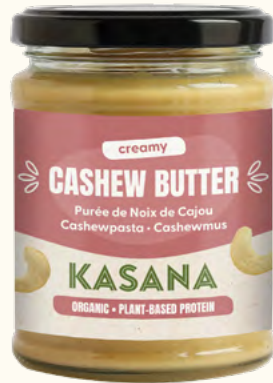
Purée de noix de cajou