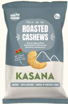
Noix de cajou grillées à la fleur de sel (Burkina Faso/Belgique)

Poids net : 150 g (sachet en plastique recyclable)