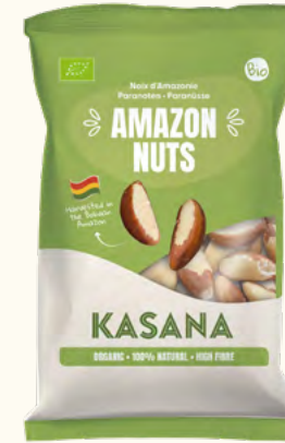
Noix d'Amazonie (Bolivie)