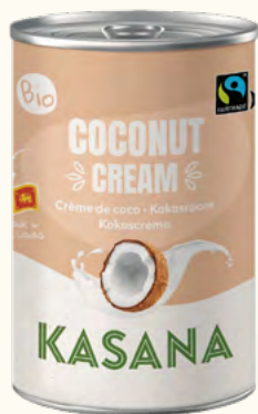
Crème de coco 24% (Sri Lanka)