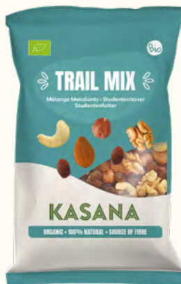
Mix Mendiants (UE/Non-UE)