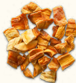
Mangues en dés (Burkina Faso)