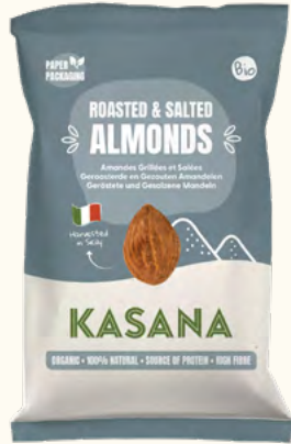
Amandes grillées & salées (Italie/Belgique)