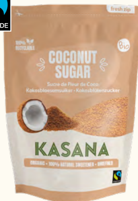
Sucre de fleur de coco (Sri Lanka)

Poids net : 300 g (sachet en plastique refermable)