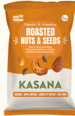
Noix & graines grillées au tamari & curcuma (UE/Non-UE)