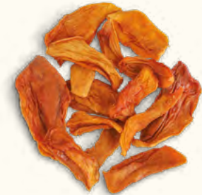
Mangues en lamelles (Burkina Faso)