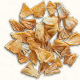
Ananas en morceaux (Ouganda/Togo)

2 kg (poche sous vide) EAN 5430000538718