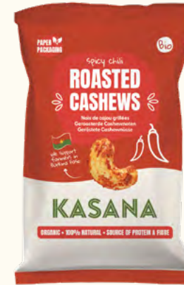
Noix de cajou grillées au chili (Burkina Faso/Belgique)