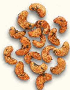
Noix de cajou grillées au tamari, nori et sésame (Burkina Faso/Belgique)