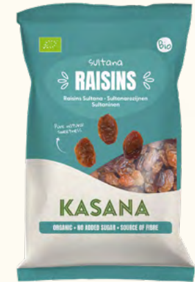
Raisins Sultana (Turquie)

Poids net : 150 g (sachet en plastique recyclable) Poids net : 150 g (sachet en plastique recyclable) Poids net : 150 g (sachet en plastique recyclable) Poids net : 100 g (sachet en plastique recyclable) Poids net : 150 g (sachet en plastique recyclable)