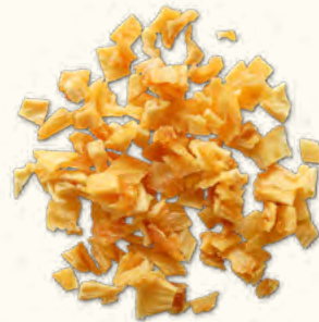
Ananas en dés (Ouganda)

2 kg (poche sous vide) EAN 5430000538398