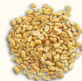
Cacahuètes grillées nature (Burkina Faso/Belgique)

2x14 kg (poche sous vide) EAN 5430001139303