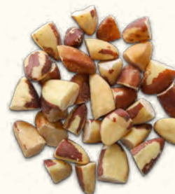
Noix d'Amazonie en morceaux (Bolivie)

5 kg (seau consigné) EAN 5430001139884 20 kg (carton) EAN 5430000538503