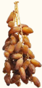
Dattes fraîches en branche (avec noyau) (Algérie)