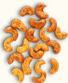
Noix de cajou grillées au tamari et curcuma (Burkina Faso/Belgique)