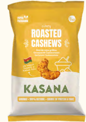
Noix de cajou grillées au curry (Burkina Faso/Belgique)

Poids net : 150 g (sachet en plastique recyclable)