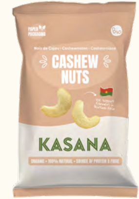
Noix de cajou (Burkina Faso)

Poids net : 150 g (sachet en plastique recyclable) Poids net : 180 g (sachet en plastique recyclable) Poids net : 150 g (sachet en plastique recyclable) Poids net : 150 g (sachet en plastique recyclable) Poids net : 150 g (sachet en plastique recyclable)