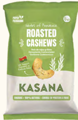
Noix de cajou grillées aux herbes de Provence (Burkina Faso/Belgique)

Poids net : 150 g (sachet en plastique recyclable)