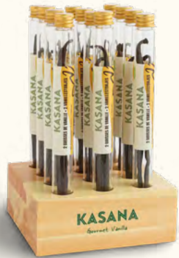
Gousses de vanille Gourmet (Ouganda)