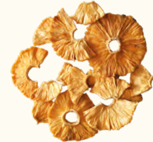
Ananas en rondelles (Ouganda/Togo)

2 kg (poche sous vide) EAN 5430000538718