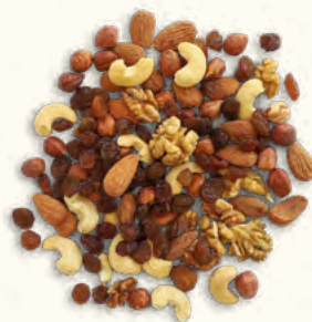
Mix Mendiants (UE/Non-UE)