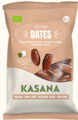
Dattes dénoyautées (Algérie)