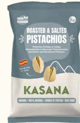
Pistaches grillées & salées (Espagne/Belgique)

Poids net : 150 g (sachet en plastique recyclable)