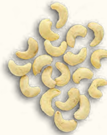
Noix de cajou entières nature (Burkina Faso)