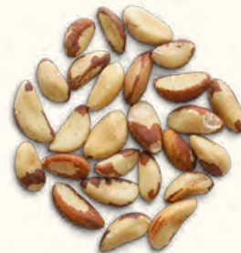
Noix d'Amazonie entières nature (Bolivie)

5 kg (seau consigné) EAN 5430001139884 20 kg (carton) EAN 5430000538503