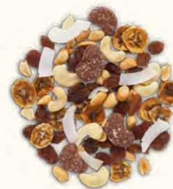
Mix Banane & Chocolat (Non-UE)