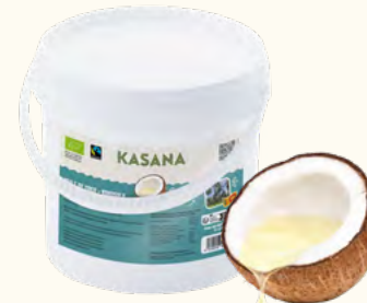
Huile de coco (Sri Lanka)

3 l (seau en plastique) EAN 5430000538176