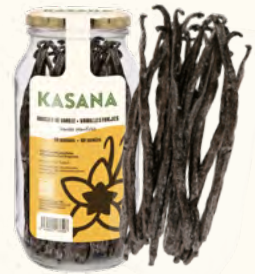
Gousses de vanille Gourmet (Ouganda)

60 gousses (bocal en verre) EAN 5430000538596