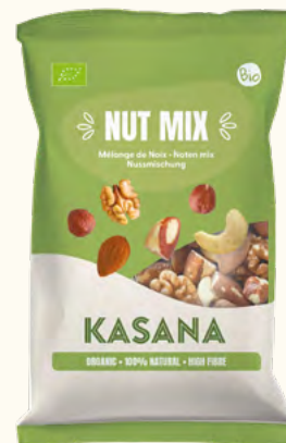
Mix de Noix (UE/Non-UE)