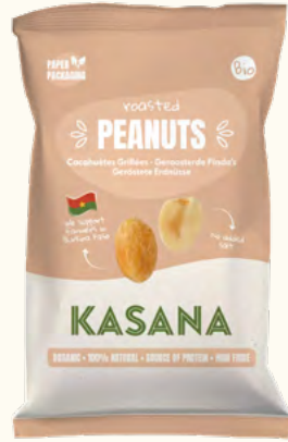
Cacahuètes grillées (Burkina Faso)