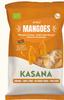
Mangues (Burkina Faso)