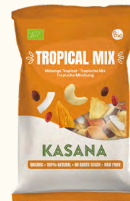
Mix Tropical (Non-UE)

Poids net : 150 g (sachet en plastique recyclable)