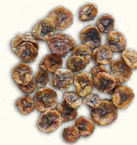
Bananes en rondelles (Togo)

2 kg (poche sous vide) EAN 5430000538718