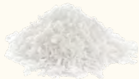
Noix de coco râpée (Sri Lanka)