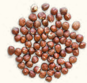
Noisettes nature (Turquie)