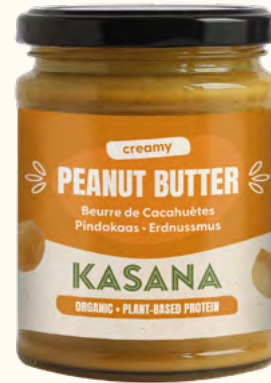
Beurre de cacahuètes «creamy»