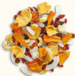
Mix Tropical (Non-UE)