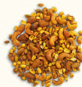
Mix de noix et graines grillées au tamari et curcuma (UE/Non-UE / Belgique)