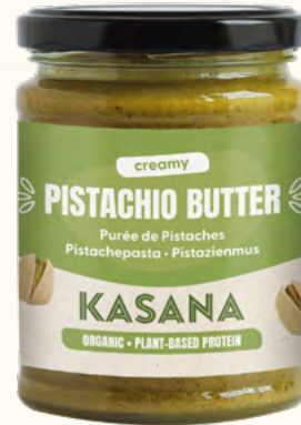
Purée de pistaches