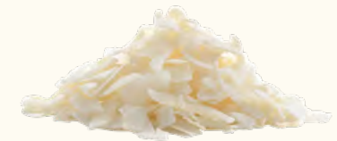
Copeaux de noix de coco (Sri Lanka)

3 l (seau en plastique) EAN 5430000538176